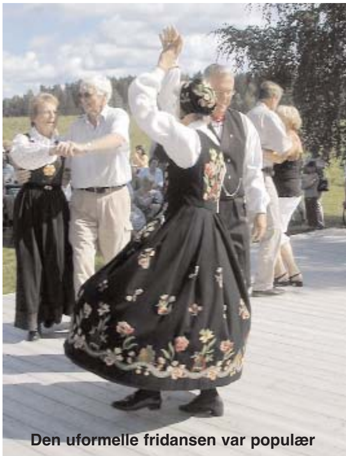
Den uformelle fridansen var populær