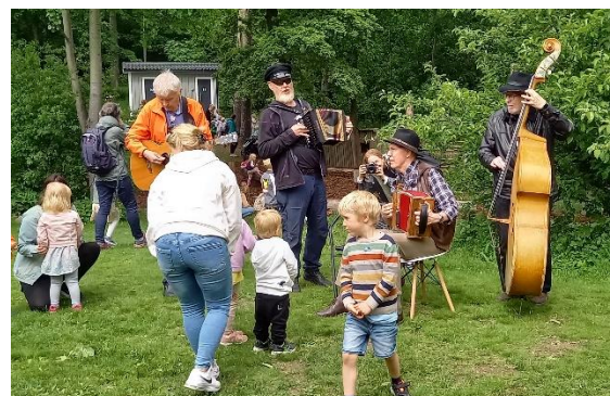
Styggen på låven spiller på Barnas dag, Follo museum 12. Juni.