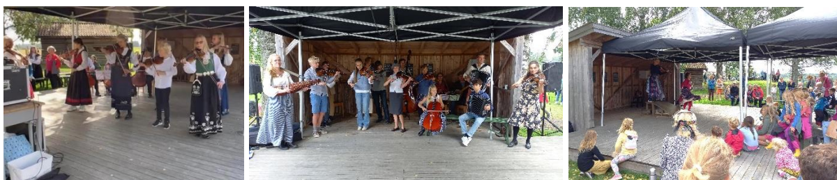
Follofeler og Svartskog spellemannslag spilte, mens barna fikk se og høre «Lum fum budli-bu» på Gamle Hvam.