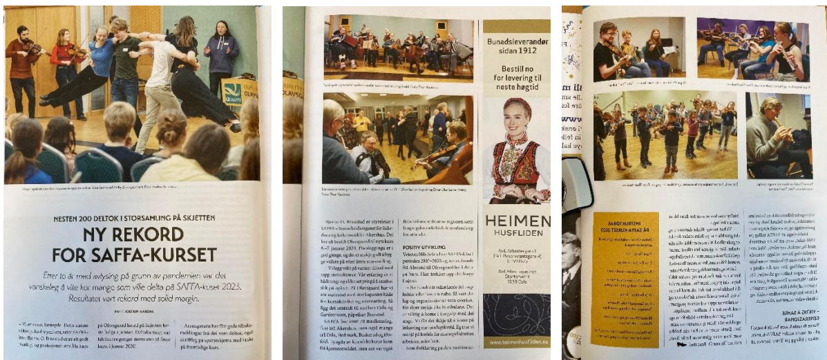
Magasinet Folkemusikk v/Jostein Aardal hadde en fin omtale av SAFFA-kurset i nr. 1/2023.

Det var likevel noen detaljer rundt kursene og lokalene som vi vil søke å rette på neste år. Mange deltakere ga detaljerte, skriftlige kommentarer, og disse er sendt til den enkelte instruktør. Noen kurs ble også litt vel store, og flere av instruktørene mente at det med én instruktør og stor variasjon i bakgrunnskunnskapene hos deltakerne, ikke bør være flere enn ca. 12 deltakere på et instrumentkurs. SAFFA-kurset i 2024 er allerede booket til samme helg, 6.-7. januar 2024.